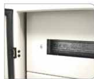
Vista de Carátula