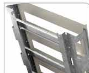
Vista de Estructura